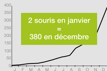
Courbe de reproduction des souris

Parce que les nuisibles sont très prolifiques et que leur présence est souvent détectée tardivement, il est indispensable de mettre en place des dispositifs de prévention afin d'éviter leur développement et la dégradation des bâtiments.